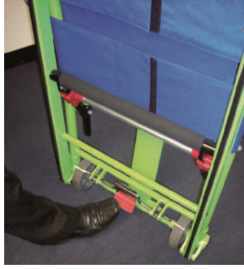
2. 赤いフットペダルをしっかりと踏み、ブレーキをかけてください。