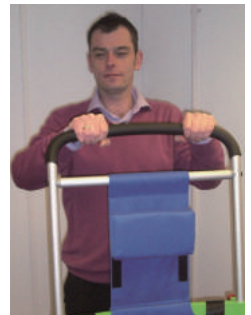
9. 写真のように、ハンドルを一番高い位置で、両手でしっかりと握ってください。