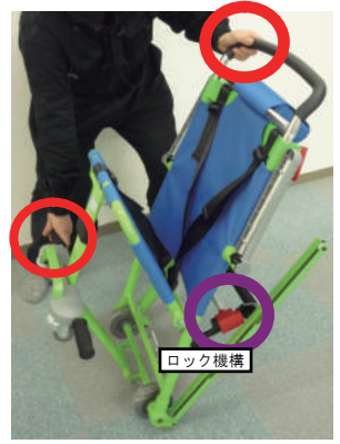
3. 折り畳まれた Excel Chair を広げます。写真の様に、左右の手で黒いハンドルとグリップを握り、しっかりと広げてください。最後に赤いロックが掛かっていることを確認してください。