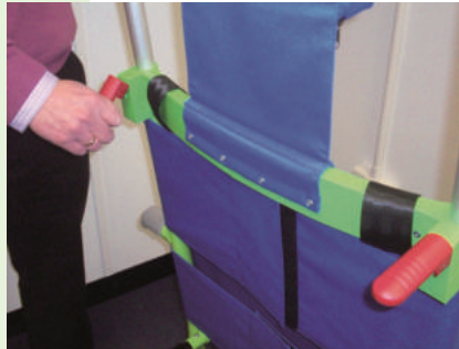
8. 非常用階段の前で一度とまり、左右の赤いスプリング・クリップを引き上げると、ハンドルの位置を変更することができます。スプリング・クリップを元の位置に戻し、一番高い位置でハンドルをロックしてください。