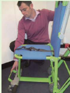
4. フットレストを広げ、セットしてください。