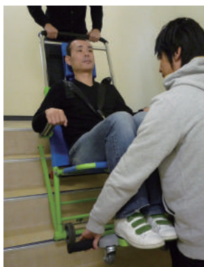
13. Excel chair は、ひとりでの操作が可能ですが、安心・安全のため、“ふたり操作”を推奨しています。前方サポーター用グリップで補助操作してください。

警告：階段での操作中は、ハンドルから絶対に手を離さないでください。 エクセルチェアが落下し、大変危険です。