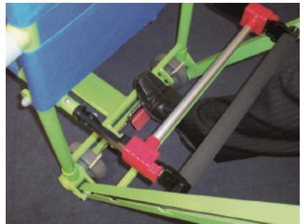
6. フットペダルで、ブレーキを解除してください。