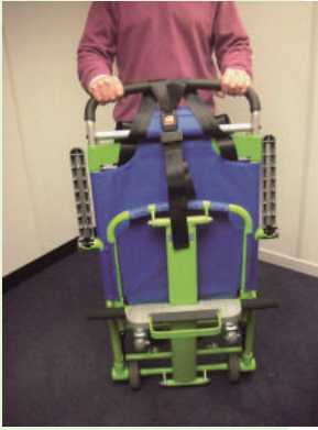
1. ダストカバーを取り外し、Excel Chair を取り出してください。