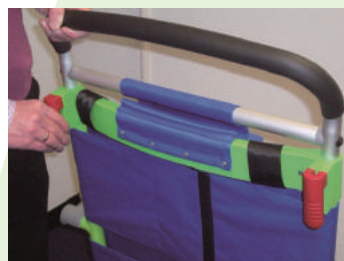
15. 赤いスプリング・クリップを操作し、ハンドルを収納してください。