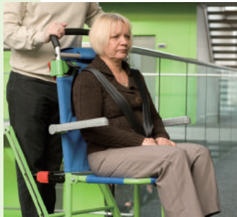
5. 乗車者が、Excel chair に移乗後、ハーネスベルトを装着、アームレストをセットしてください。足がフットレストに収まらない場合は、レッグベルトで固定してください。