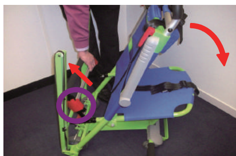
16. シルバーのロック解除バーを引くと赤いロック機構が解除されます。ロック解除バーを引きながら、背面部を前に倒すと、Excel Chair を折り畳むことができます。