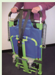
17. ハーネスベルトをハンドルとフットレストに通して、ロックすることにより、折り畳み時に、コンパクトに保つことが可能です。