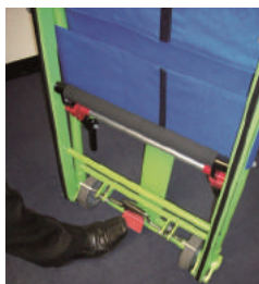
14. ブレーキをかけてください。