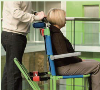
7. 非常用階段までの移動は、写真のようにハンドルの高さを一番低い位置にして、押手をしっかりと握り、操作してください。