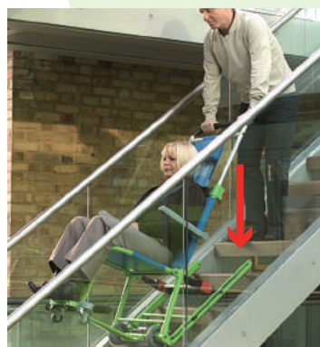
12. 前輪を浮かせるイメージでハンドルを↓の方向に体重をかけるように、押し込みながら階段を降りてください。

警告：階段での操作中は、ハンドルから絶対に手を離さないでください。 エクセルチェアが落下し、大変危険です。